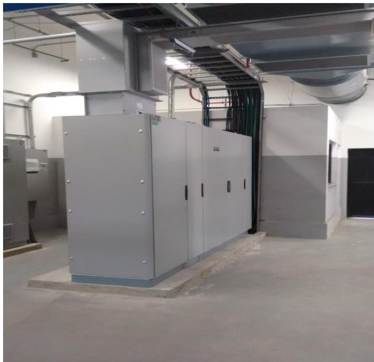
FUNDAÇÃO OSWALDO CRUZ RIO DE JANEIRO-CAG QUADRO GERAL DE DISTRIBUIÇÃO